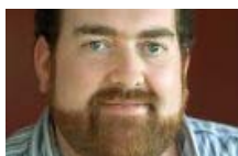
TÉLÉVISION ET RADIO